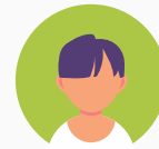
Enseignant et personnel de soutien