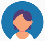
Famille & aidants

Enfin, il importe de connaître les membres de l'équipe que vous serez peut-être appelé à contacter. Voici un exemple d'une équipe interdisciplinaire et des fournisseurs de services qui peuvent intervenir dans les programmes ou les activités scolaires de votre enfant.