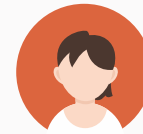
Psychologue & professionnel de la santé mentale

Tisser des liens avec votre équipe-école demande du temps, de la patience et de la bienveillance, et ce de la part des deux parties. Au fil de votre parcours scolaire, vous gagnerez en confiance dans votre capacité à naviguer dans ce système et à nouer des relations avec les bonnes personnes.