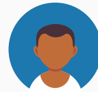
Analystes du comportement agréés